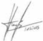
Tobias Strauß Erster Bürgermeisterin