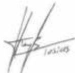
Tobias Strauß Erster Bürgermeister